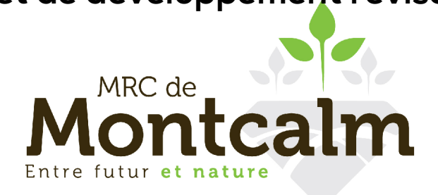
Schéma d'aménagement et de développement révisé