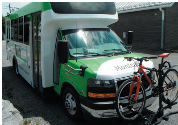
1 Transport collectif Supports à vélo